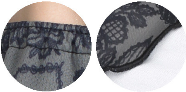
鼻部・裾部のアップ